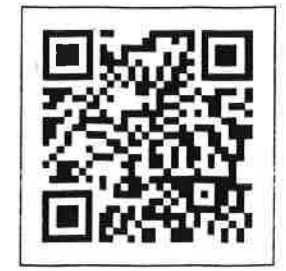
WEB 出願 QR コード

本校では、紙面での出願と WEB 上での出願がお選びいただけます。 紙面での出願を希望される方は募集要項内の【入学願書】をお使いください。 WEB 出願をご希望される方は、右の QR コードを読み込んで出願してください。 証明写真データの登録がございますので、事前にご用意ください。